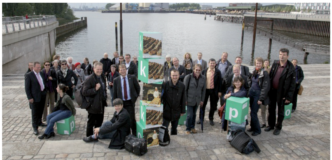
Bremen, 17. bis 18. Mai 2011